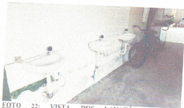
FOTO 22: VISTA DOS LAVATÓRIOS A REVITALIZAR C/ BANCADA E INSTALAÇÕES.