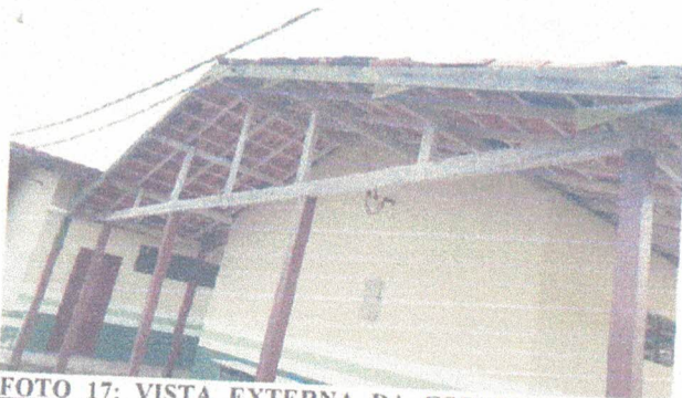
FOTO 17: VISTA EXTERNA DA COBERTURA A REVITALIZAR C/ ESTRUTURA E TELHAS PLAN.