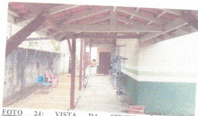
FOTO 24: VISTA DA CIRCULAÇÃO A REVITALIZAR COM ESTRUTURA E TELHAS PLAN.