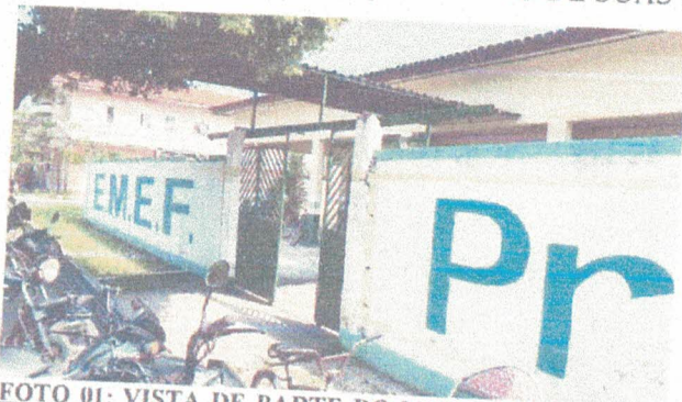
FOTO 01: VISTA DE PARTE DO MURO FRONTAL QUE APRESENTA MAIORES PROBLEMAS FÍSICOS.

CONSTATA-SE A SITUAÇÃO ATUAL DE SUAS INSTALAÇÕES FÍSICAS.