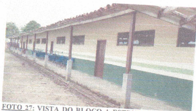
FOTO 27: VISTA DO BLOCO A ESTRUTURAR EM CONCRETO ARMADO E TROCA DE ESQUADRIAS.