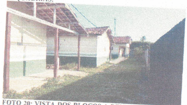
FOTO 20: VISTA DOS BLOCOS A REVITALIZAR E CONSTRUIR PASSARELA DE ACESSO A ELES.