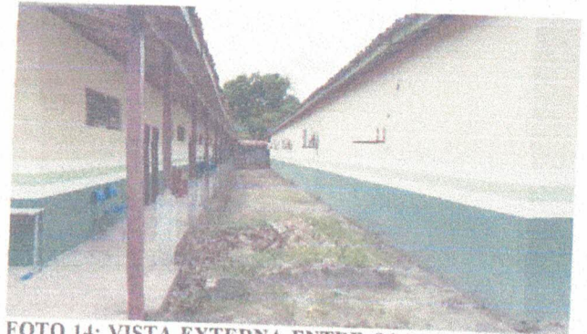
FOTO 14: VISTA EXTERNA ENTRE OS BLOCOS A ESTRUTURAR COBERTURA C/ TELHAS PLAN.