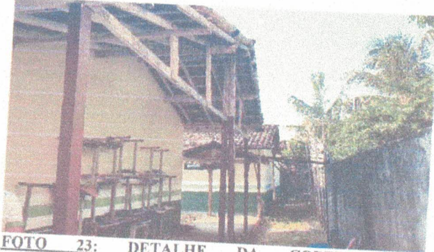
FOTO 23: DETALHE DA COBERTURA DETERIORADA À EXECUTAR NOVA C/ TELHAS PLAN.