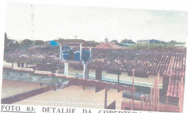
FOTO 03: DETALHE DA COBERTURA TODA DETERIORADA, INCLUSIVE FORRO E ELÉTRICA.