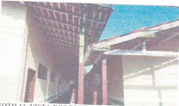
FOTO 13: VISTA DOS BLOCOS A REVITALIZAR P/ KORODUR E COBERTURA COM TELHAS PLAN.