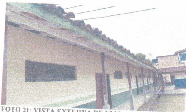
FOTO 21: VISTA EXTERNA DE UM DOS BLOCOS A REVITALIZAR COBERTURA, PISO E ESQUADRIAS.