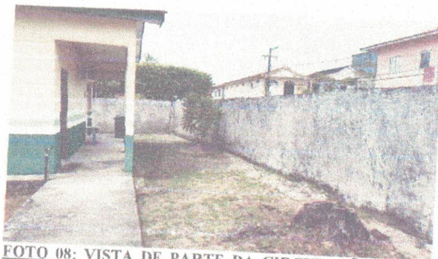
FOTO 08: VISTA DE PARTE DA CIRCULAÇÃO A CONSTRUIR PASSARELA COBERTA.