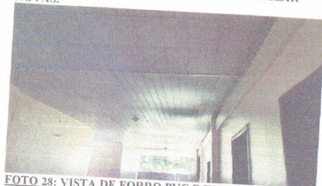
FOTO 28: VISTA DE FORRO PVC E INSTALAÇÕES ELÉTRICAS A SEREM REVISADAS.