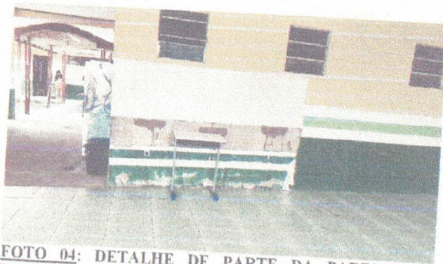
FOTO 04: DETALHE DE PARTE DA PAREDE INTERNA DETERIORADA, BLOCO DE SERVIÇO.