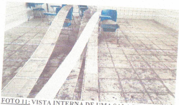
FOTO 11: VISTA INTERNA DE UMA SALA DE AULA COM FORRO E PISO A REVITALIZAR.