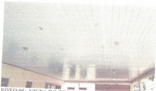
FOTO 05: VISTA DO FORRO PVC DO REFEITÓRIO QUE NECESSITA DE REFORMA.