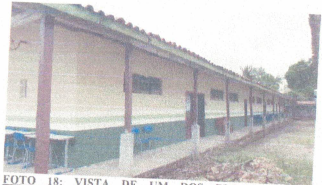
FOTO 18: VISTA DE UM DOS BLOCOS A REVITALIZAR A COBERTURA, PISO E ESQUADRIAS.